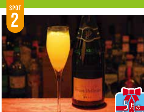
ミモザ(搾りたてオレンジシャンパン)...1,650円

fudan cafe (for modern living) 宇都宮 栃ナビ!をオープンして大変なときも、楽しいときも、 妻とよく通ったお店です。あの時2人でよく行ったカ フェも、今は食べ盛りの子2人の4人家族で!楽し く・美味しく・リラックスして過ごす我が家のオアシ スです。