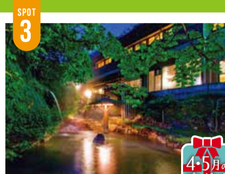
日帰り入浴(大人)...1,000円 ※休業日あり。