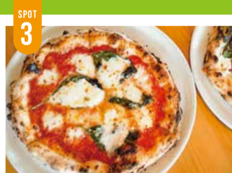
マルゲリータ...1,050円/リコッタチーズ...1,650円

沖縄雑貨の店 ていらていら&ていらCafe 小山 沖縄では定番のスパムおにぎり~ちょっと塩味の効い たポークランチオンミートにご飯、さらに「豚肉みそ」 は隠し味と!!これがとてもとてもイケるのです◎!!