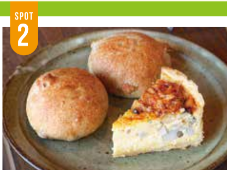
今日のキッシュ...300円/クルミアンパン...190円

パネッテリア ファリーナ 宇都宮 イギリス食パンを6枚切りにしてもらい翌朝食べました が、そのままでもしっとり柔らか、トーストしたらサクサ ク♪前日のパン詰め合わせに入っていたハイジのクリ ムパン、人気No.1だけあって美味しかったです(^o^)