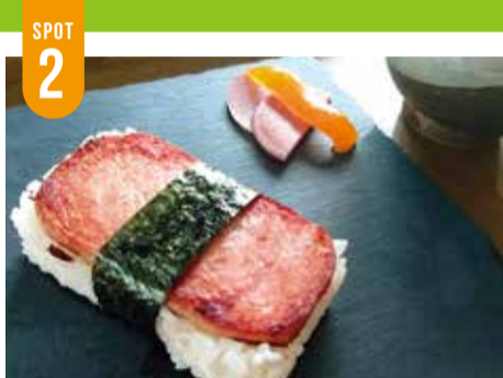
ポークおにぎりセット(もずくスープ付)...1,078円

T's Serkage' ティーズ・セルカジェ 小山 私の定番【Aランチ/1,500円(税別)】。一品一品手が 込んでいてマスターの情熱や想いが伝わってきます! 特にパスタは細麺で湯で加減が抜群!私の中ではこ ちらのパスタが一番の好みですね。