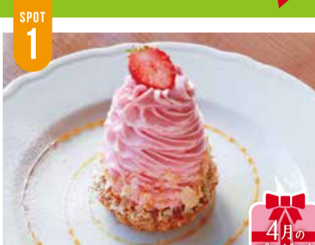
いちごのモンブラン...600円 ※季節限定。

栃ナビ!社長さん (40代 男性/宇都宮) なりすましではありません。 本物です。